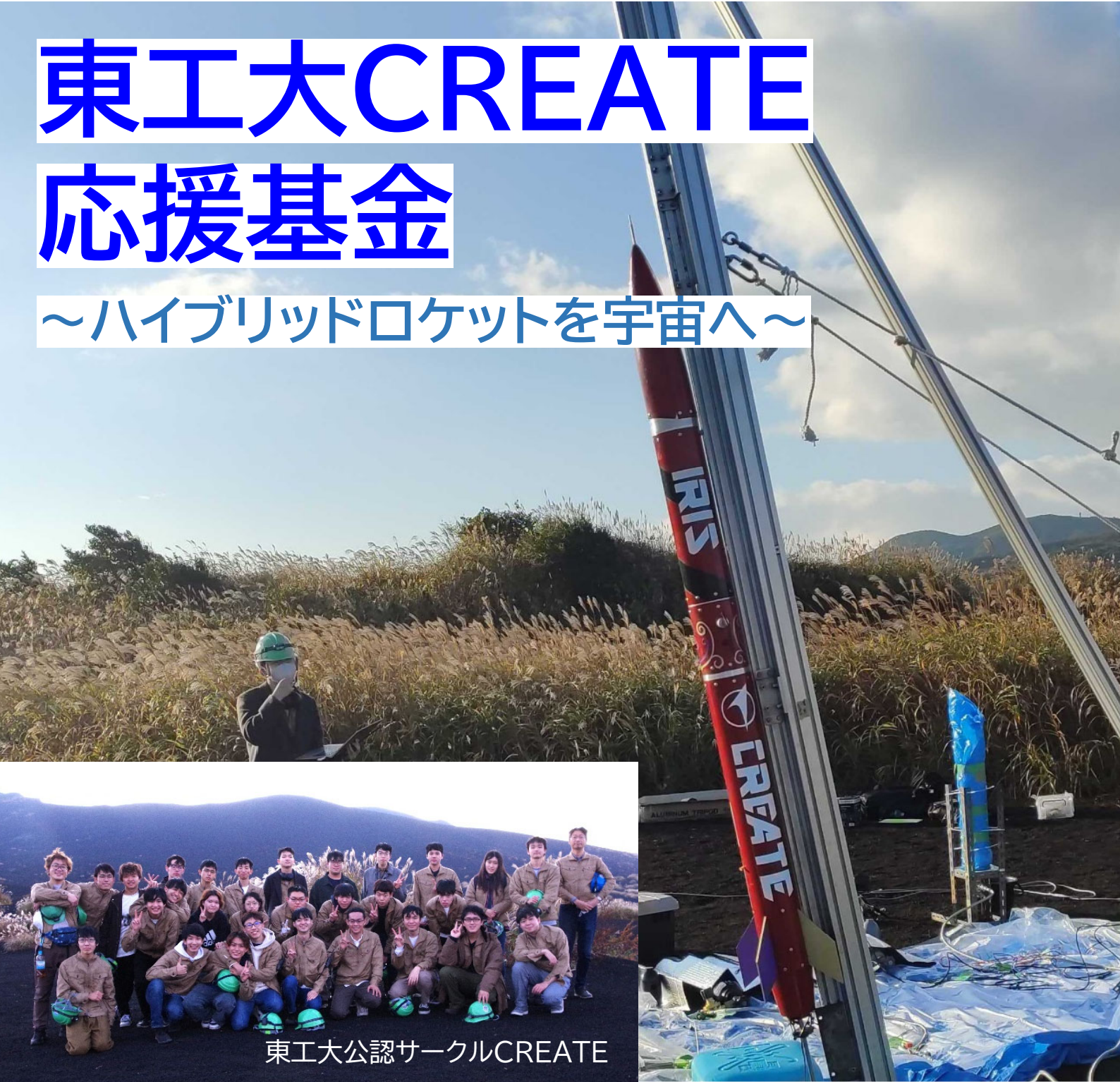
東工大公認サークルCREATE